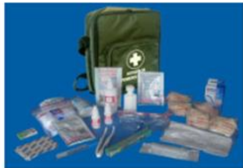
Morral en lona impermeable Dimensiones: 31 x 33,5 x 12 cm