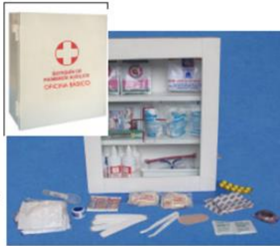
468234 Estuche metálico con llave, pintura electrostática. 468235 Estuche en madera con puerta en acrílico con llave. Dimensiones: 24 x 29 x 12 cm