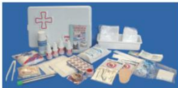
Estuche plástico. Dimensiones: 28 x 18,5 x 7,5 cm