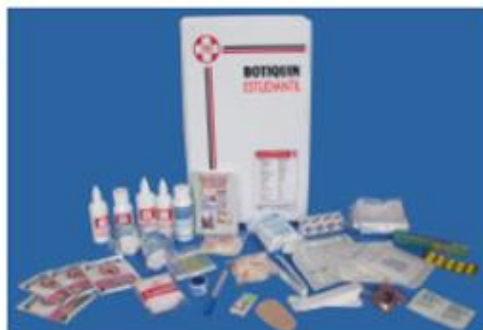
Estuche plástico portátil con correa. Dimensiones: 38,2x24x7,5