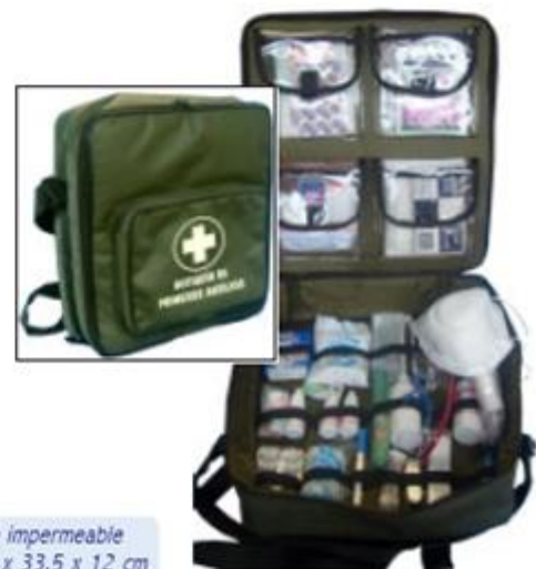
Morral en lona impermeable Dimensiones: 31 x 33,5 x 12 cm