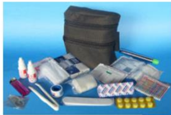
Estuche en lona impermeable, con pasador para llevar al cinto Dimensiones: 10 x 12,5 x 6 cm