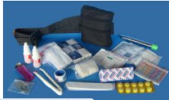
Estuche en lona impermeable, con pasador para llevar al cinto. Dimensiones: 10 x 12,5 x 6 cm