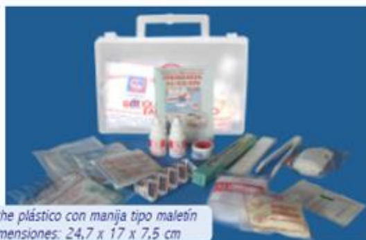
Estuche plástico con manija tipo maletín Dimensiones: 24,7 x 17 x 7,5 cm