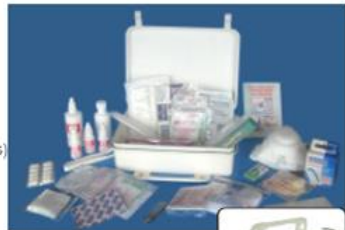
Estuche plástico Dimensiones: 38,2 x 24 x 7,5 cm