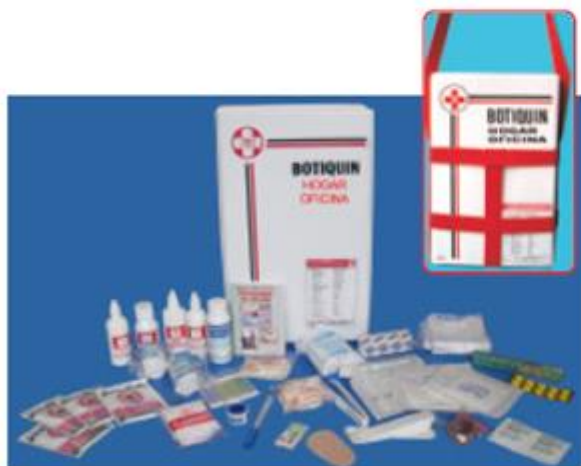
Estuche plástico con 2 divisiones internas Dimensiones: 38,2 x 24 x 7,5 cm