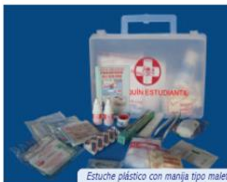
Estuche plástico con manija tipo maletín Dimensiones: 24,7 x 17 x 7,5 cm